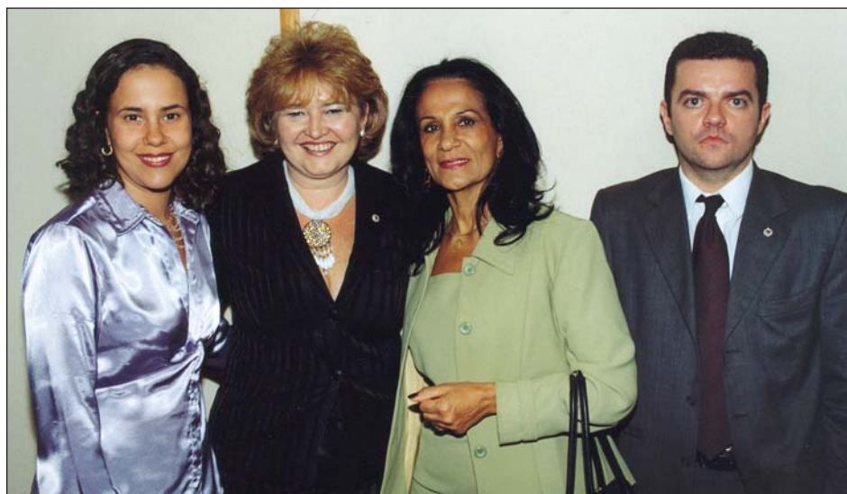
Presidente da ANAJUR prestigiou a solenidade de posse da diretoria da Escola Superior da PGFN

Em seu discurso, o Ministro da Fazenda ressaltou a importância dos Procuradores da Fazenda Nacional para o Estado. Já o Procurador-Geral da Fazenda Nacional destacou a missão da Escola: propor a revisão das bases filosóficas em que se assentam institutos que não mais respondem à angústia dos que procuram solucionar seus litígios perante o Estado, contribuindo, assim, para o